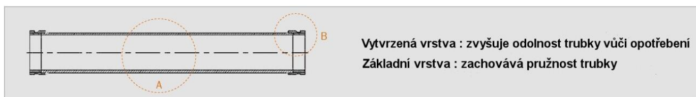
“ A ” Detail : Spirálová struktura (jako pružina)